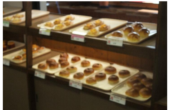
上段 第40回ゆうあいスポーツ大会 下段左：新開店「パンのいえ ボンジュール」 下段右：パン種類豊富